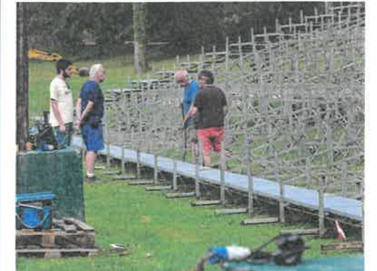
Outre le montage des tribunes, les bénévoles s'occupent aussi de la mise en électricité du site.

Le bénévolat est le carburant de toute association. Connaissance de la Meuse n'échappe pas à la règle. Join de là. Et sans ces bénévoles les différents spectacles (Les Flammes à la lumière, la Biennale équestre, la fête de saint Nicolas, la Balade merveilleuse et la fête médiévale) n'existeraient pas.