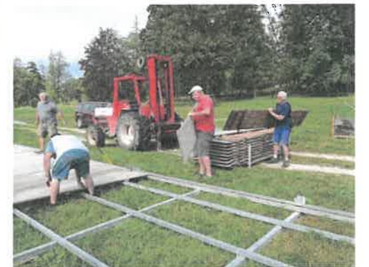
Les bénévoles s'activent au château de Thillombois.

Tous font preuve d'un réel savoir-faire grâce, notamment, aux diverses habilitations que les bénévoles acquièrent grâce à l'investissement de l'association.