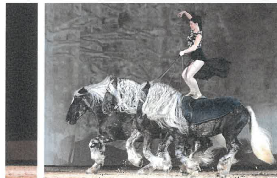
La compagnie Jehol évolue notamment avec des chevaux de trait, de race comtoise.