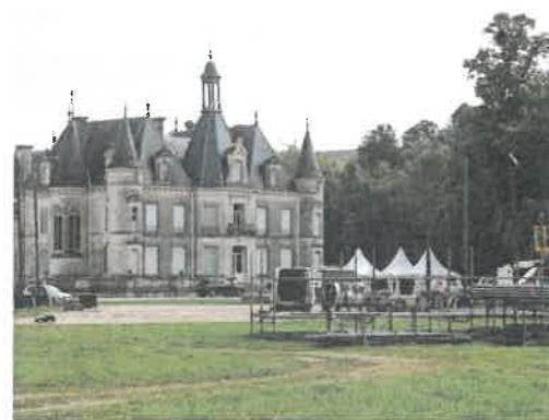
Le travail des bénévoles est à découvrir samedi 7 septembre.